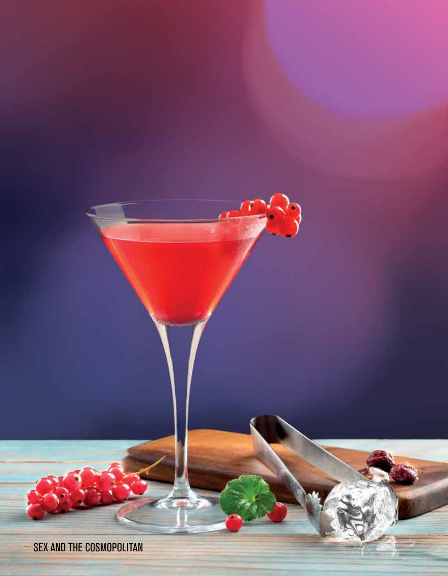
SEX AND THE COSMOPOLITAN